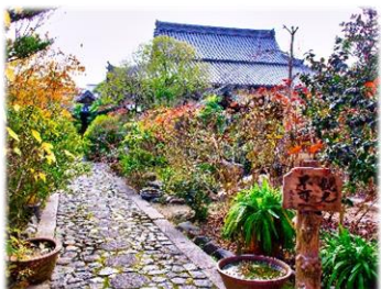
天真院 境内の様子