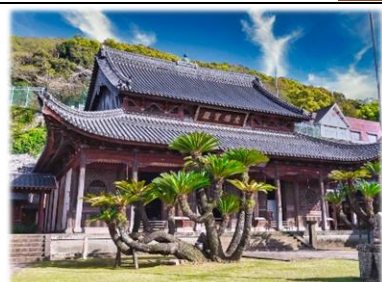
滞留中の隠元禅師を 訪ねた長崎 興福寺